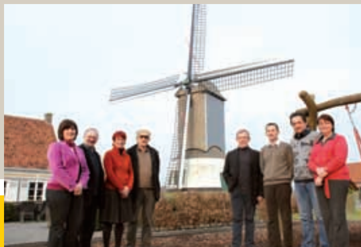
Gistel in de ban van de wind: zowel de ultra-moderne windturbine's als de volledig gerestaureerde Oostmolen zijn een visitekaartje voor Gistel.