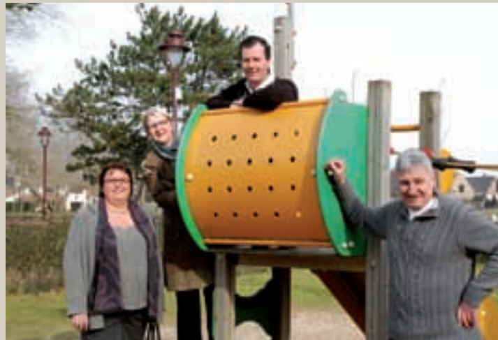
Onthaasten in De Haan. De afgelopen jaren werd het domein La Potinière heringericht tot een groen en kindvriendelijk park.