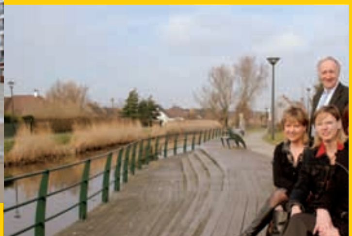
Renovatie van de Stationsstraat en de naastliggende oevers van het vaardeken in Oudenburg.