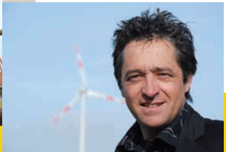
Bezorgd voor de toekomst van de wereld waar onze kinderen zullen in opgroeien, groene energie, ook in Gistel ... een must