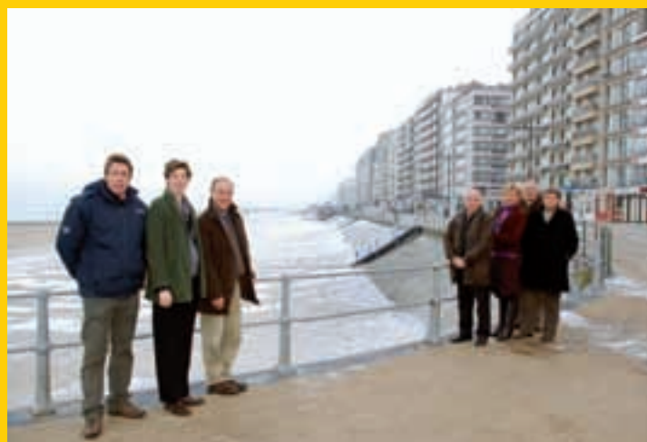
Verbreding van de Zeedijk in Middelkerke.