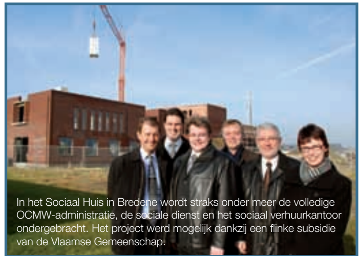
In het Sociaal Huis in Bredene wordt straks onder meer de volledige OCMW-administratie, de sociale dienst en het sociaal verhuurkantoor ondergebracht. Het project werd mogelijk dankzij een flinke subsidie van de Vlaamse Gemeenschap.