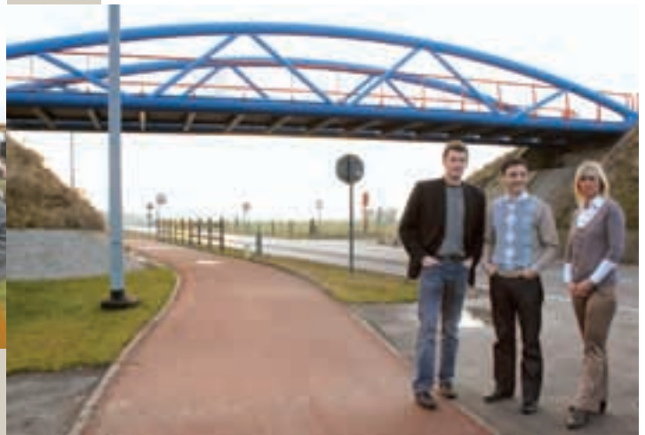
Vernieuwing Gistelsesteenweg in Oostende met aandacht voor de zwakke weggebruiker.