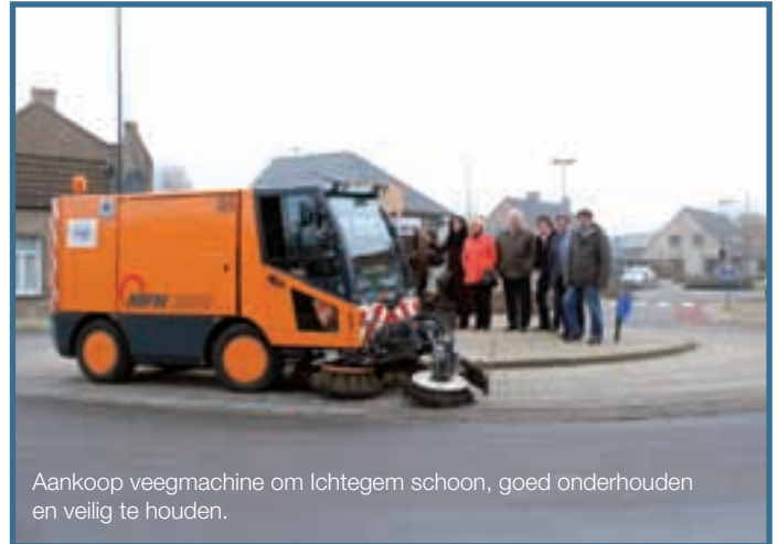
Aankoop veegmachine om Ichtegem schoon, goed onderhouden en veilig te houden.

Liefst 95 procent van het Vlaams regeerakkoord is verwezenlijkt. Het resultaat is voelbaar tot in alle hoeken van de regio Oostende. Hieronder vindt u enkele concrete realisaties uit uw buurt.