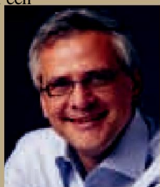
Kris Peeters Minister-President van Vlaanderen

Vlaanderen slaagde er bovendien in op minder dan 10 jaar tijd schuldenvrij te worden. In 1999 bedroeg de Vlaamse schuld nog meer dan 8 miljard euro. Die schuld is intussen herleid tot 0. Nu willen we vooruitkijken. Het toekomstplan 'Vlaanderen in Actie' moet van Vlaanderen een topregio in Europa maken, met werk voor iedereen in een goed leefklimaat.